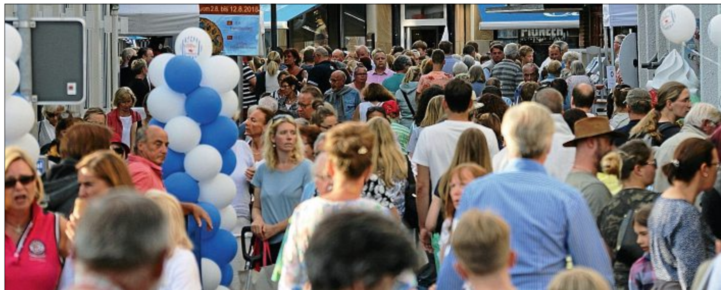
In allen Straßen waren am Mittwoch die Nachtbummler unterwegs – wie hier in der Poststraße.

Das Sportschießen für Gäste beginnt um 20 Uhr im Schützenhaus an der Meierei.