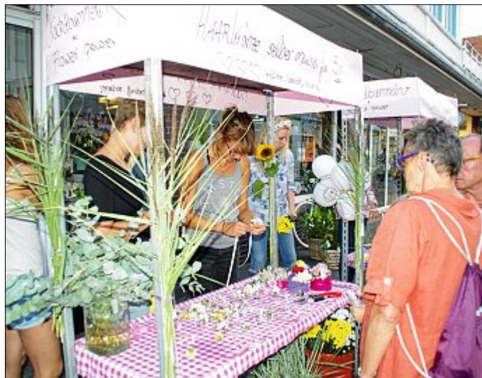
Sommeratmosphäre bei Blumen Boekhoff: Am Stand konnte man sich selber einen bunten Blumenkranz binden.